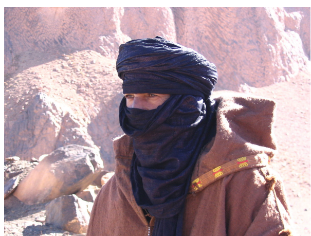
Hombre tuareg del desierto de Argelia.

Los pastores libres imghad ( imghad plural; amghid singular) son propietarios de cabras y algunos camellos. En el Ahaggar son llamados kel ulli , 'los de las cabras'. En algunos lugares tienen también ovejas e incluso bovinos y les corresponde pastorear también los rebaños de los aristócratas de su ettebel , de los cuales se consideran vasallos. Algunos linajes de pastores son mestizos iregeynatan (singular arageyna ) y se les considera también libres aunque con un estatus propio. [3]